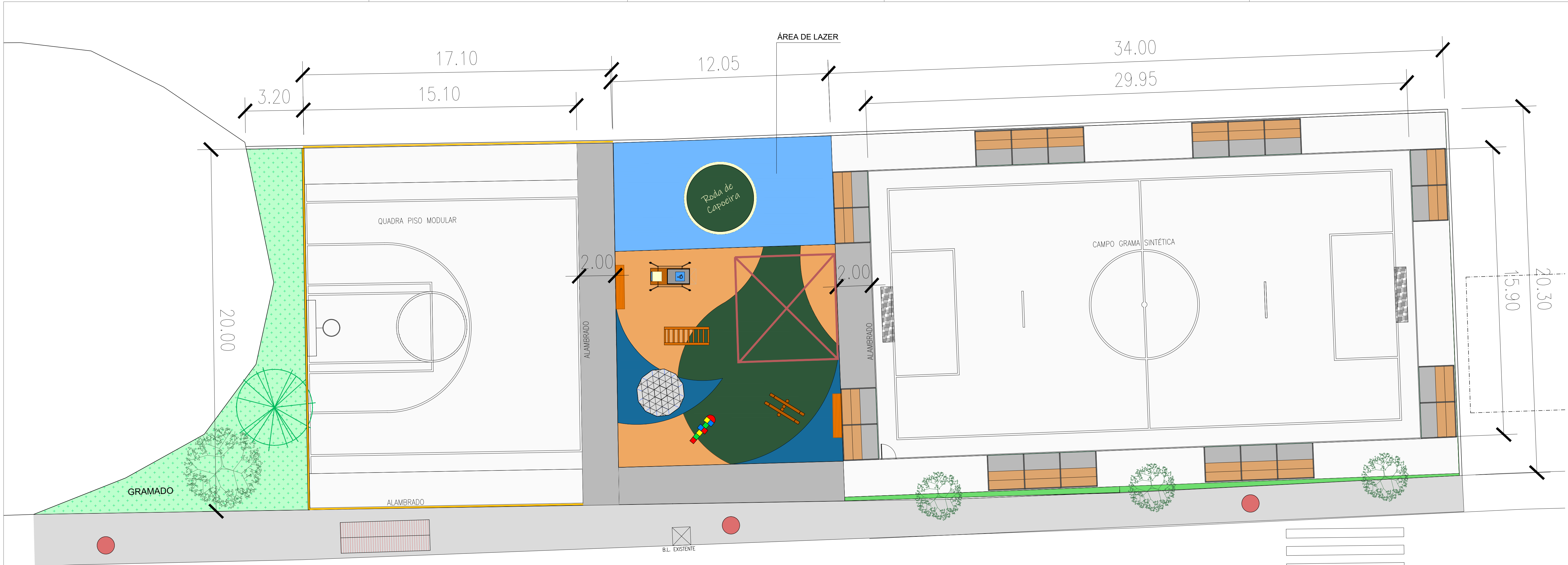
IMPLANTAÇÃO GERAL ESC.: 1:100