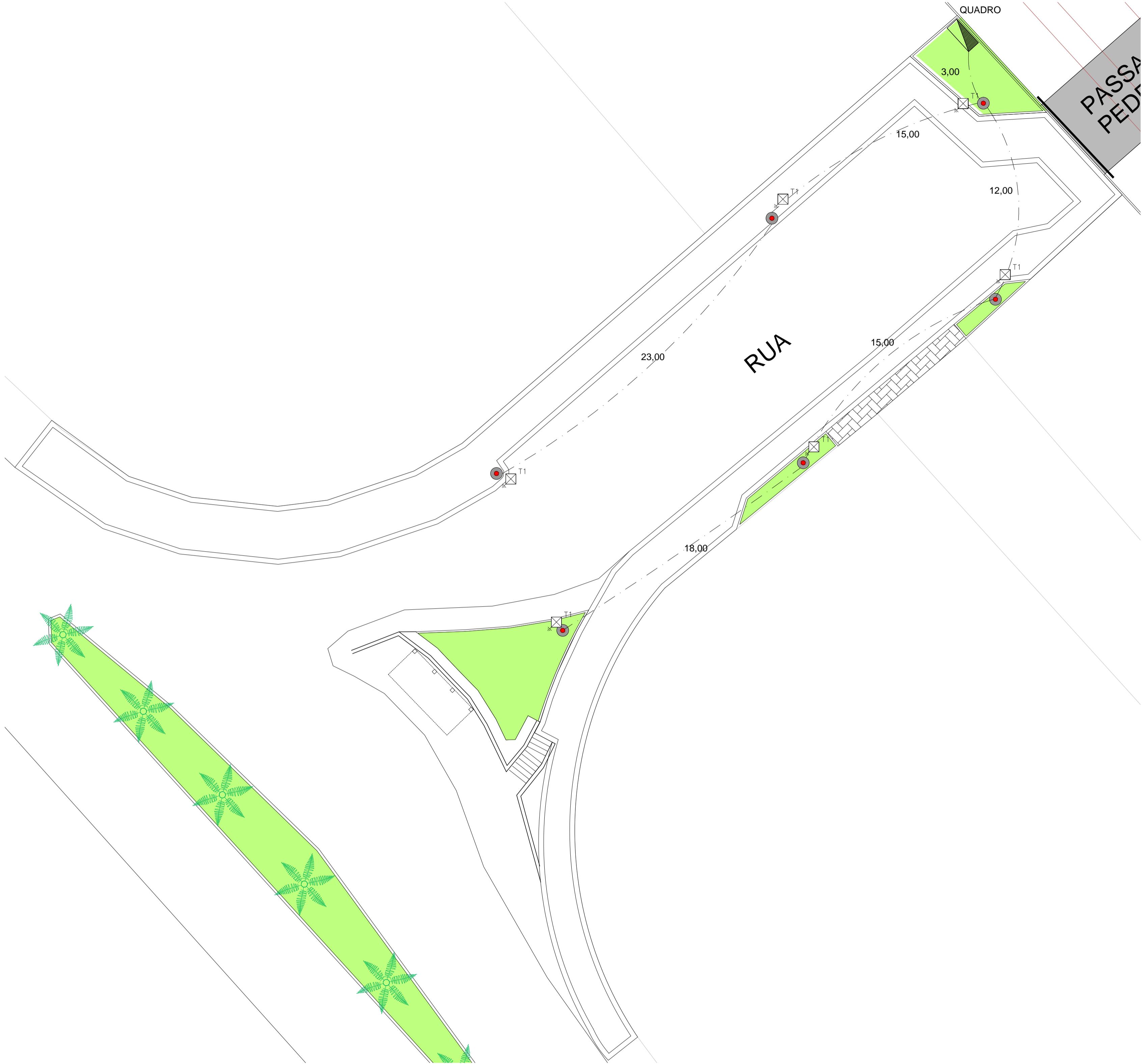
PASSEIO PONTO DE PEDRA ESC.: 1:150