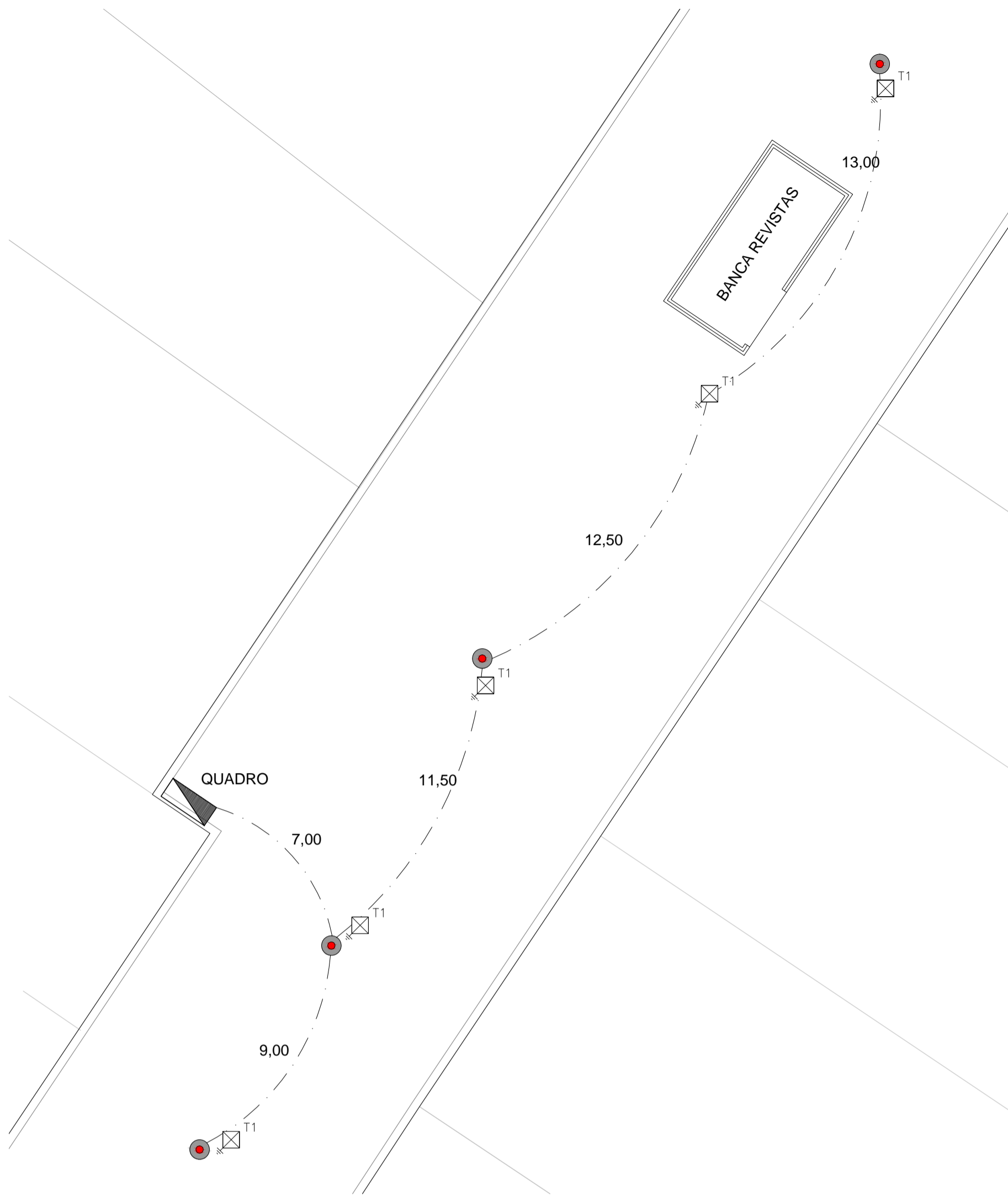
CALÇADÃO R. DO COMÉRCIO ESC.: 1:150