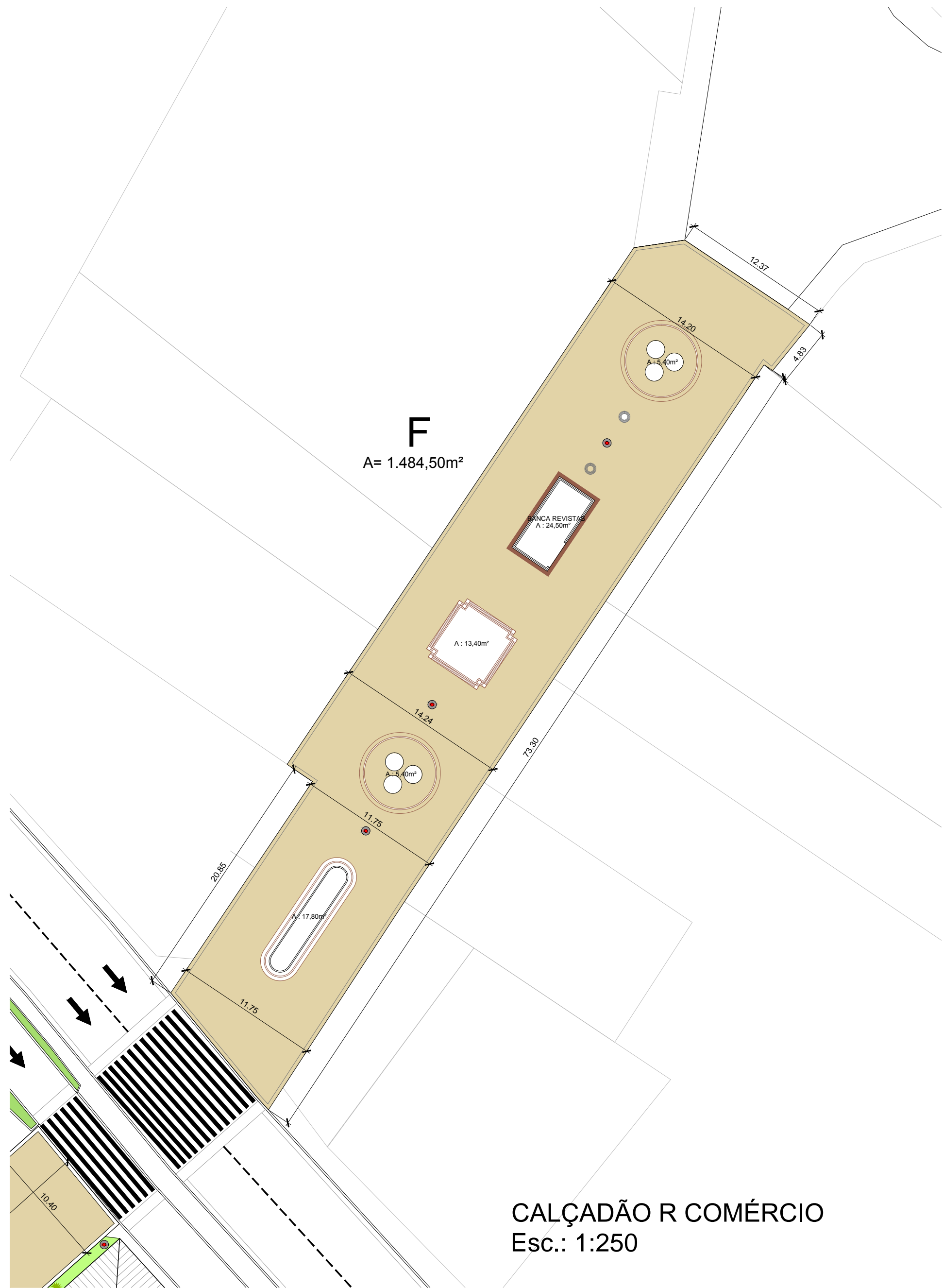
CALÇADÃO R COMÉRCIO Esc.: 1:250