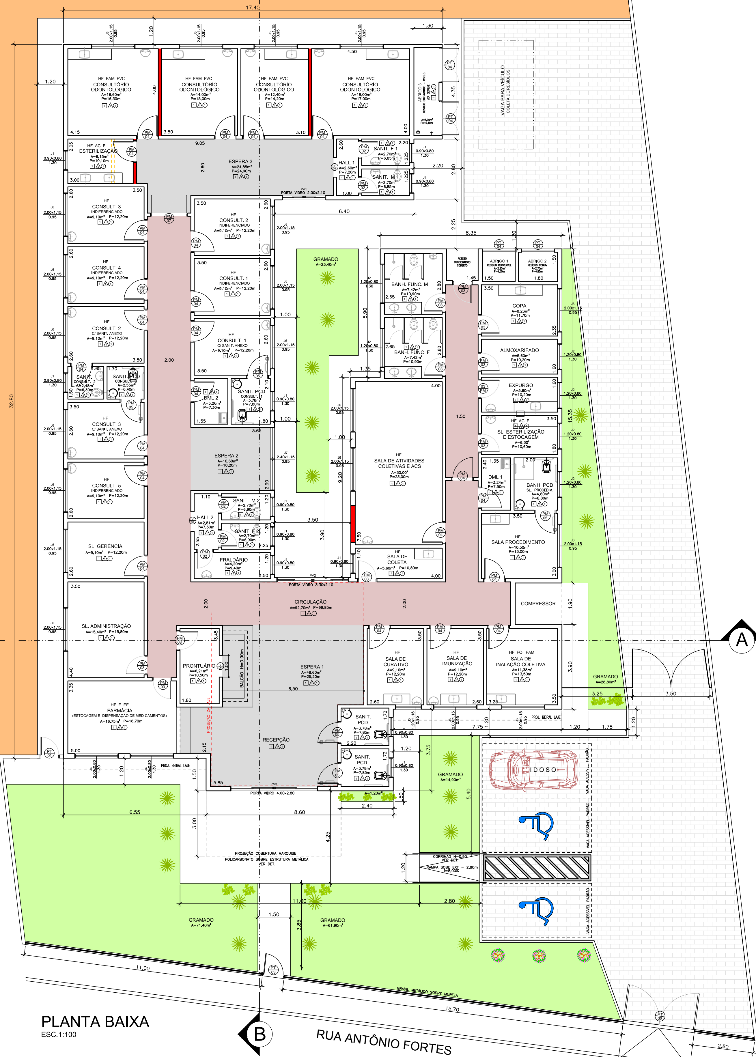
PLANTA BAIXA ESC. 1:100

INSTALAÇÕES ESPECIAIS HF - ÁGUA FRIA FO - OXIGÊNIO FVC - VÁCUO CLÍNICO EE - ELÉTRICA DE EMERGÊNCIA FAM - AR COMPR. MEDICINAL AC - AR CONDICIONADO E - EXAUSTÃO