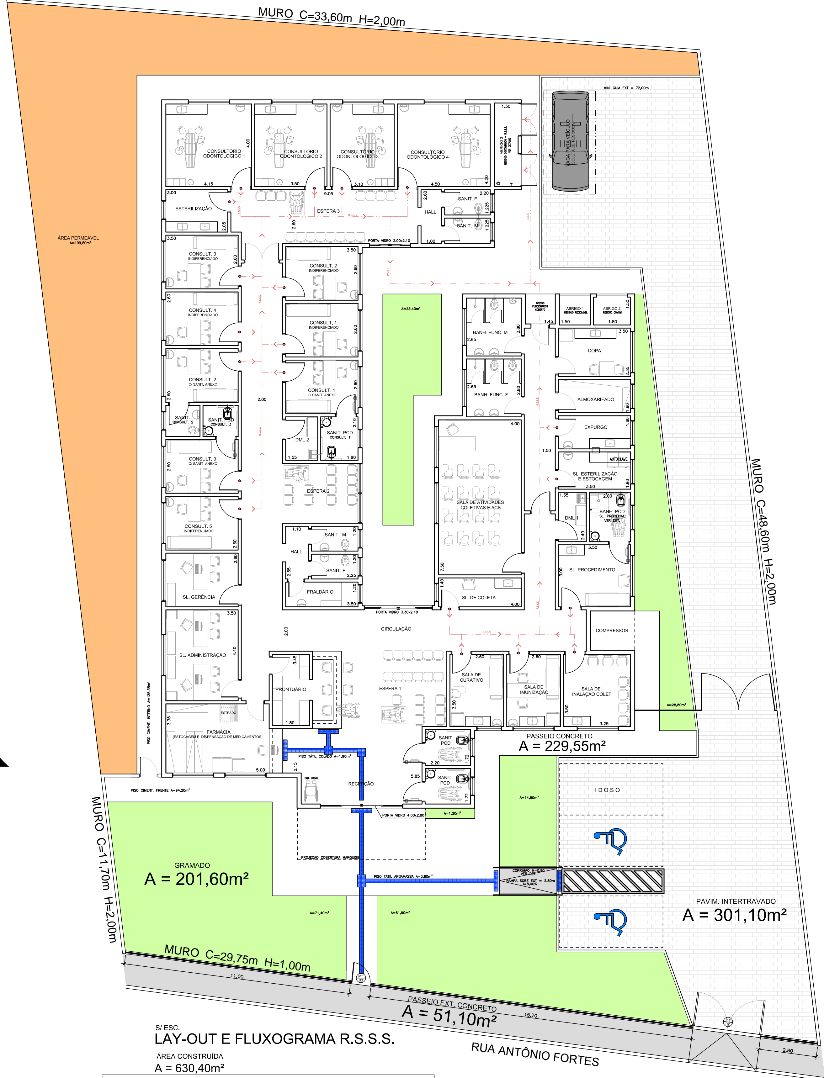
S/ ESC. LAY-OUT E FLUXOGRAMA R.S.S.S.